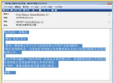
中国語のビジネスメールを全文読み上げ