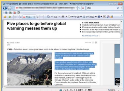
英語のWebサイトを範囲指定読み上げ