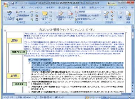
日本語で作成された業務指示書を範囲指定読み上げ